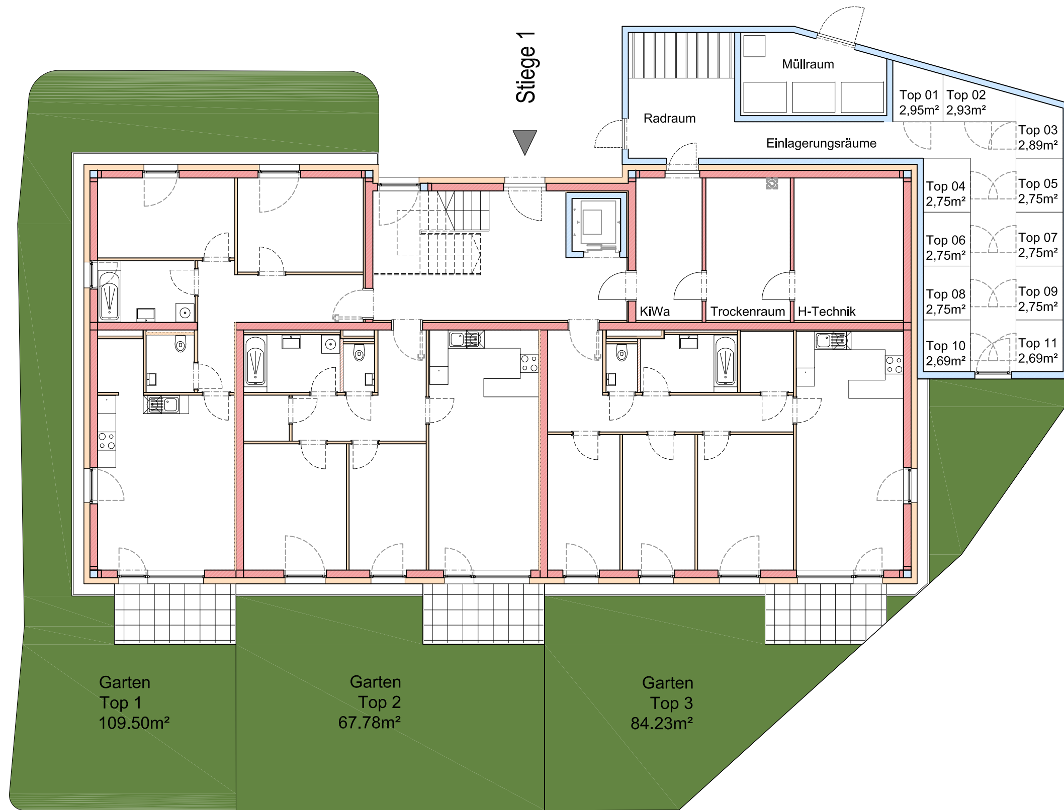
ÜBERSICHTSPLAN STIEGE 1 M 1:125